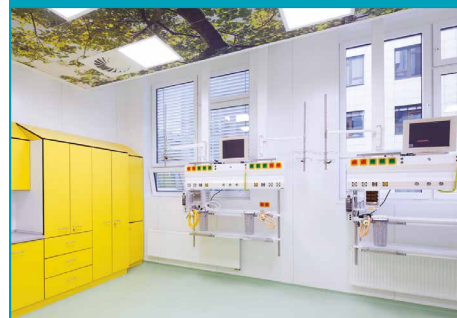
Технологические среды и медицинские газы