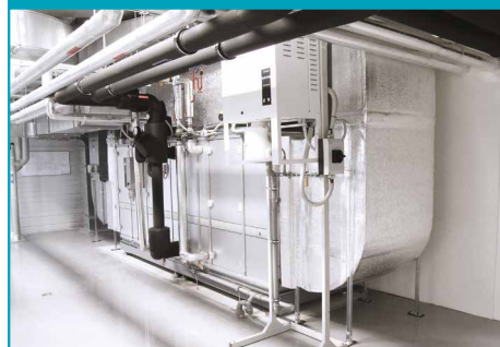
HVAC (отопление, вентиляционная система, охлаждение)