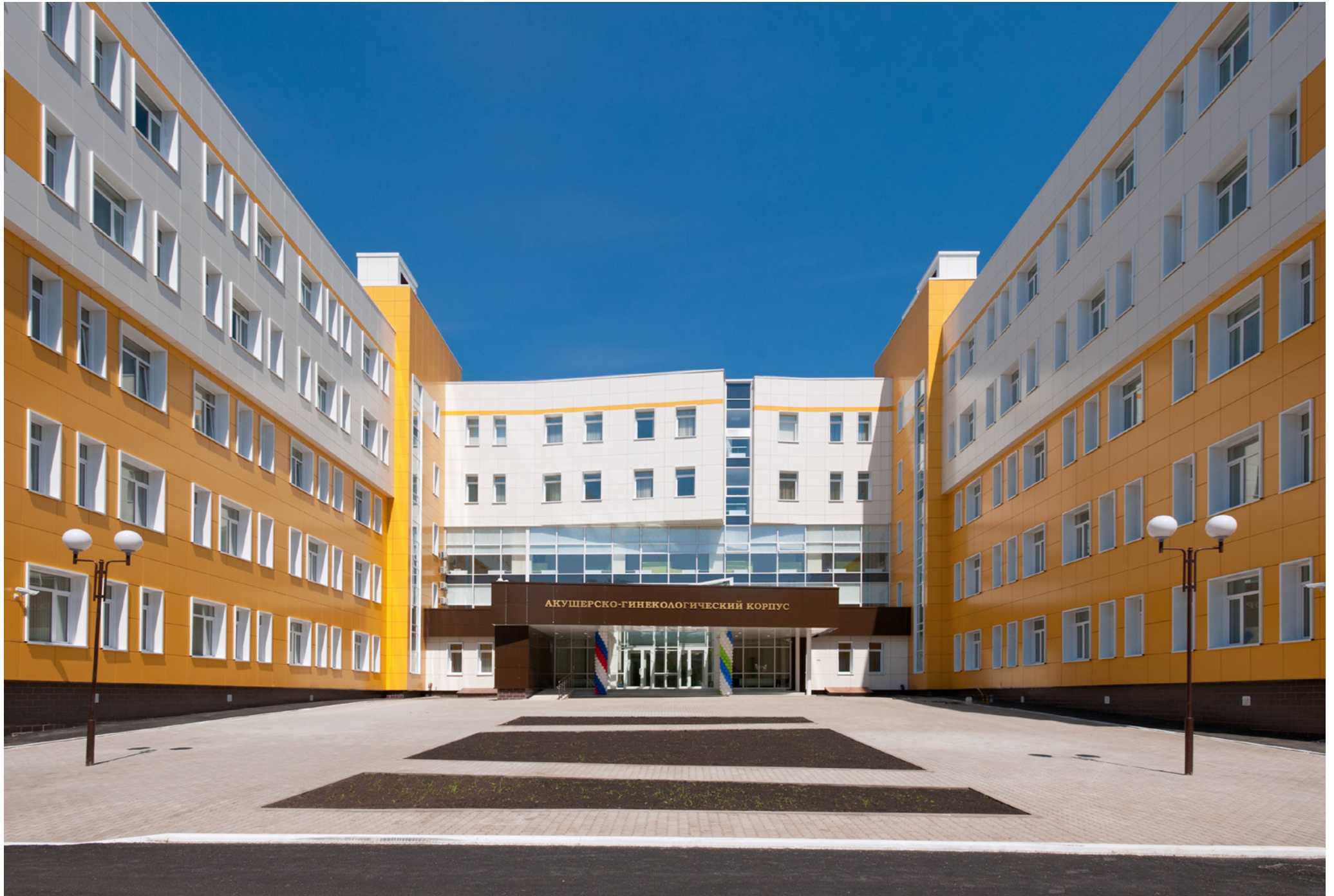
Obstetric and gynaecological corps with volume of 120 beds | Ufa Hospital | Russian federation | 2013