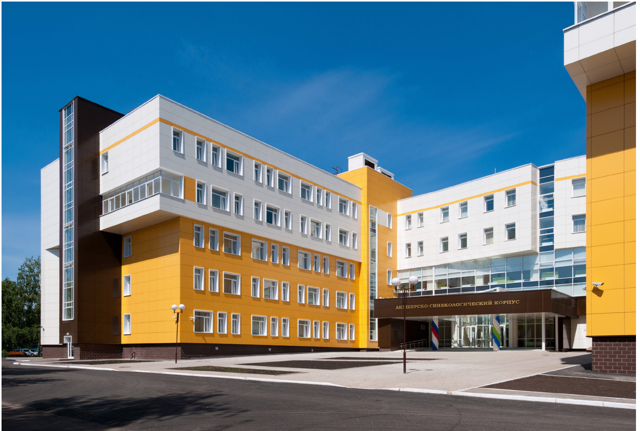
Obstetric and gynaecological corps with volume of 120 beds | Ufa Hospital | Russian federation | 2013