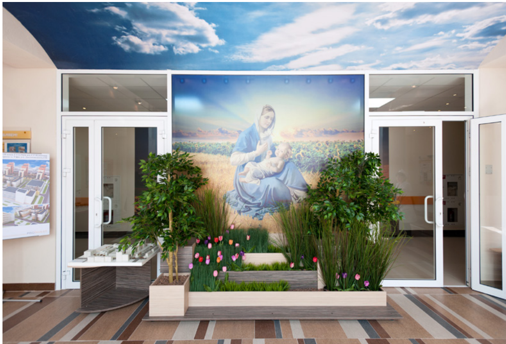
Obstetric and gynaecological corps with volume of 120 beds | Ufa Hospital | Russian federation | 2013