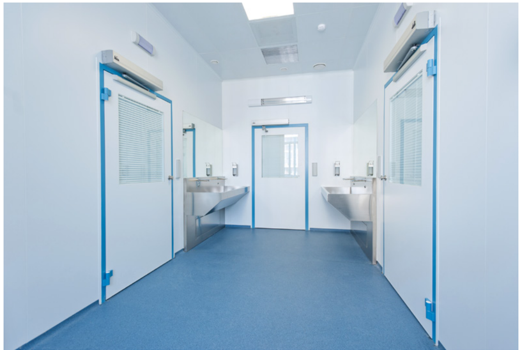
Obstetric and gynaecological corps with volume of 120 beds | Ufa Hospital | Russian federation | 2013