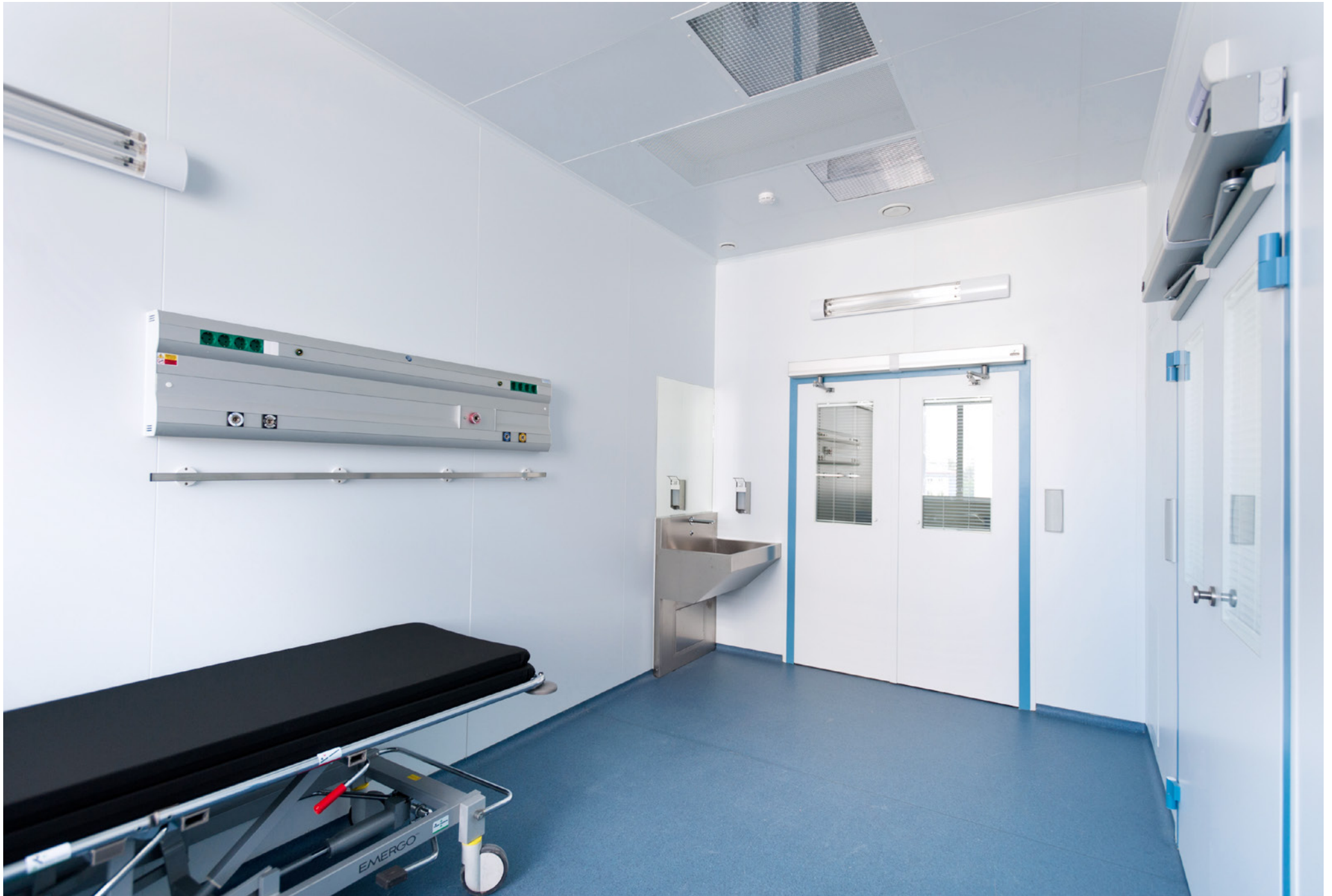
Obstetric and gynaecological corps with volume of 120 beds | Ufa Hospital | Russian federation | 2013