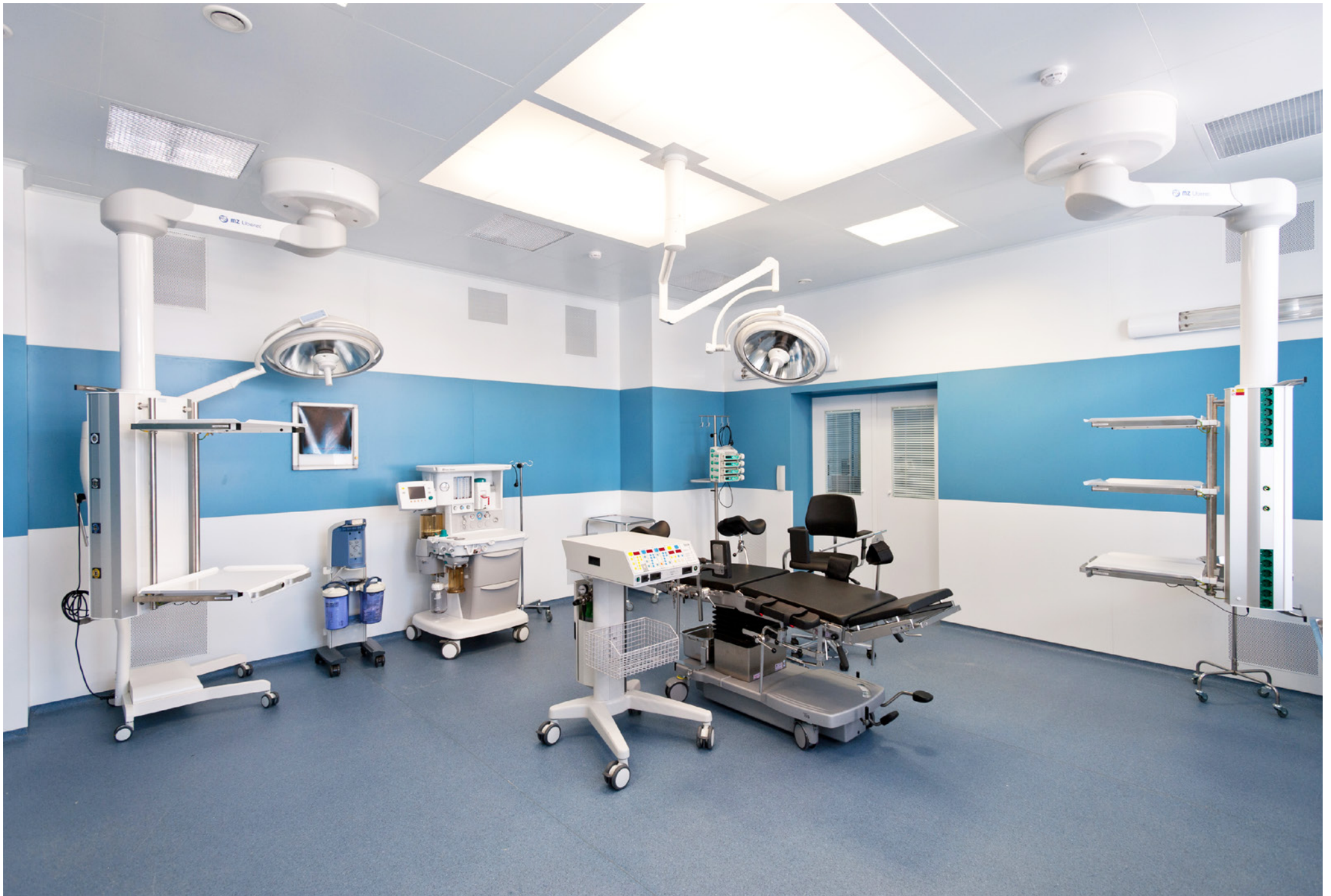
Obstetric and gynaecological corps with volume of 120 beds | Ufa Hospital | Russian federation | 2013