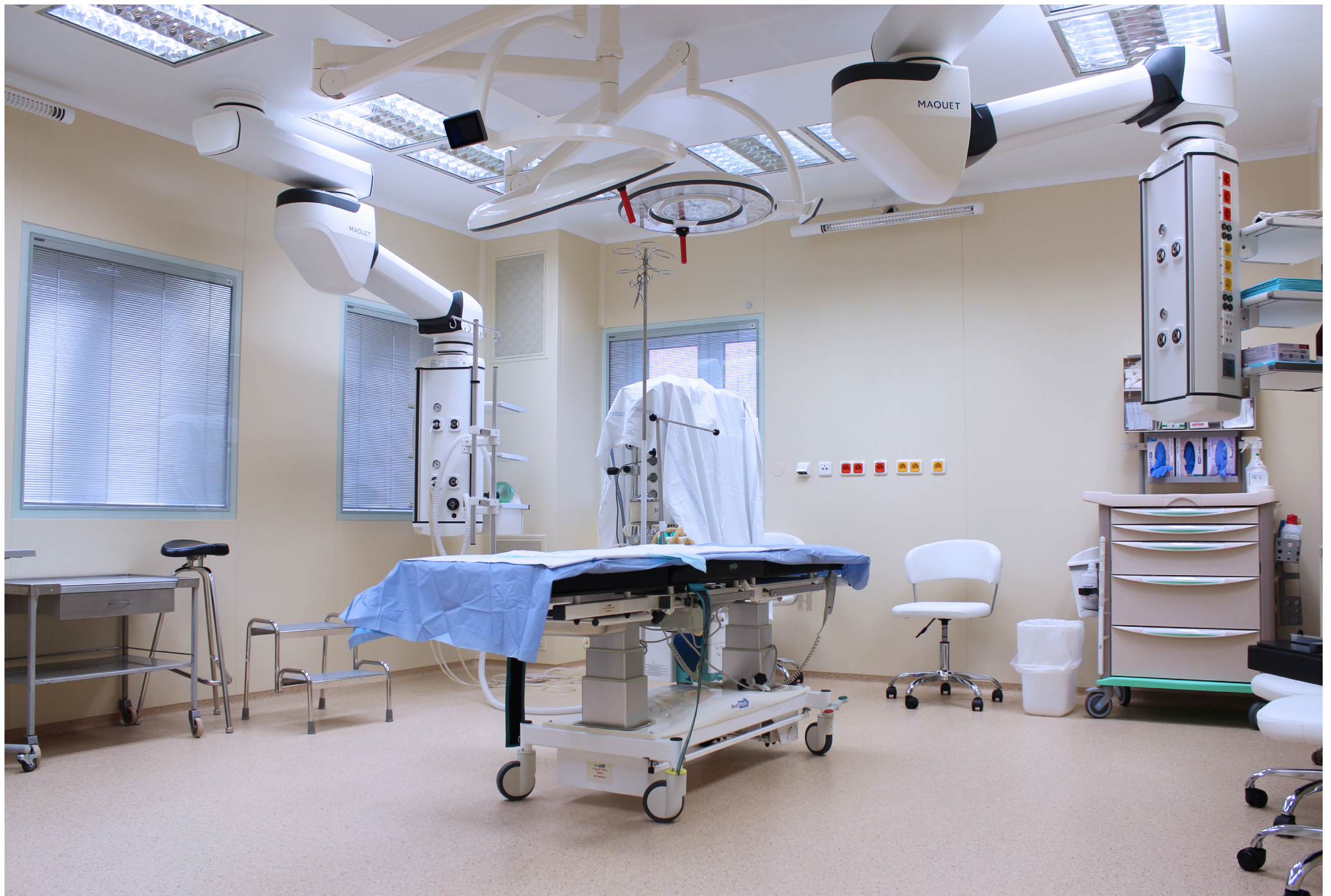
Fakultná nemocnica s poliklinikou Skalica, a.s. | Faculty Hospital with Polyclinic in Skalica, a.s. | АО «Университетская больница с поликлиникой г. Скалица»