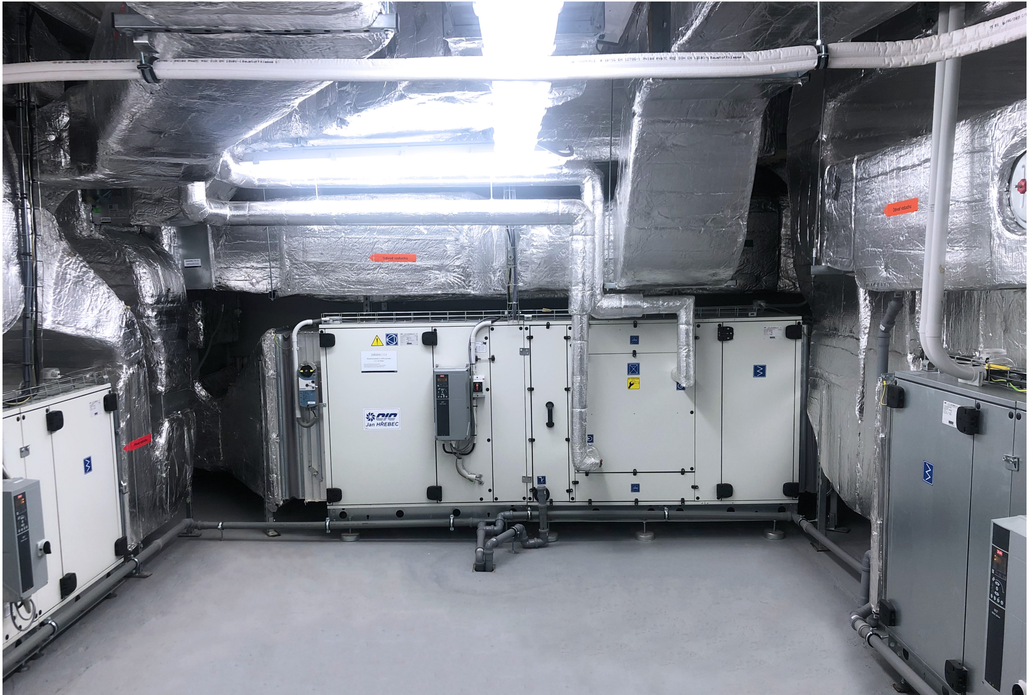
Fakultná nemocnica s poliklinikou Skalica, a.s. | Faculty Hospital with Policlinic in Skalica, a.s. | АО «Университетская больница с поликлиникой г. Скалица»