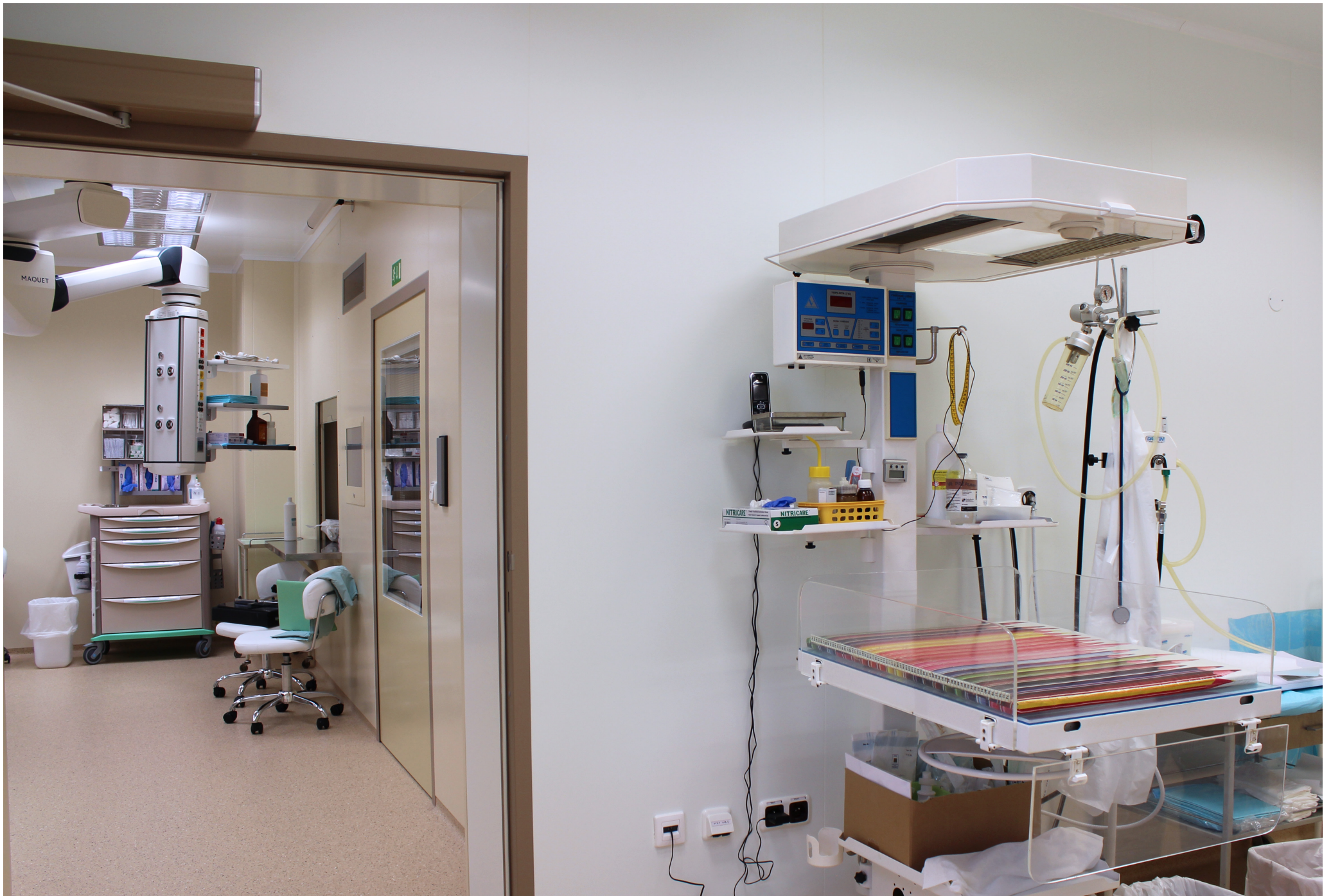
Fakultná nemocnica s poliklinikou Skalica, a.s. | Faculty Hospital with Polyclinic in Skalica, a.s. | АО «Университетская больница с поликлиникой г. Скалица»