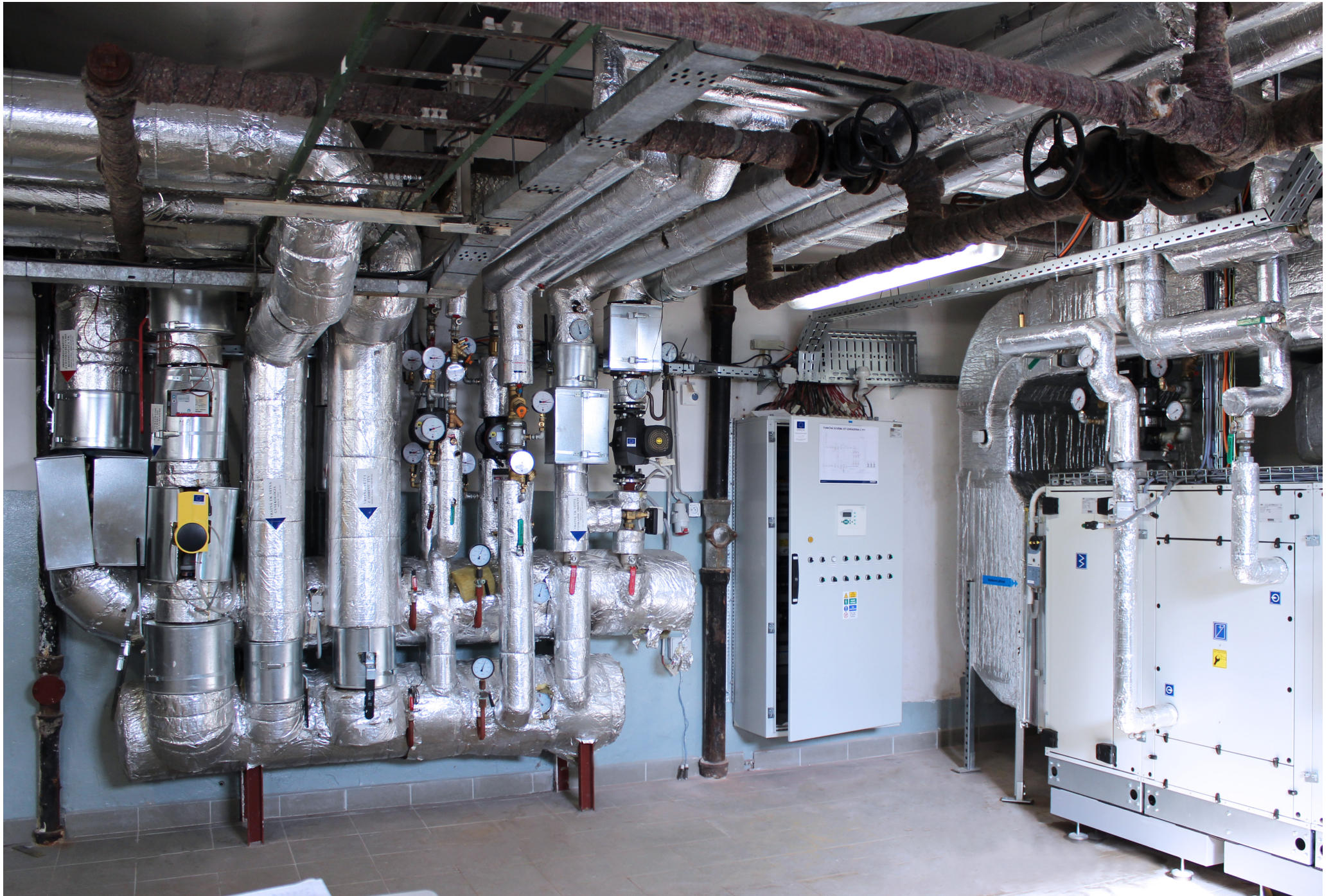
Fakultná nemocnica s poliklinikou Skalica, a.s. | Faculty Hospital with Policlinic in Skalica, a.s. | АО «Университетская больница с поликлиникой г. Скалица»