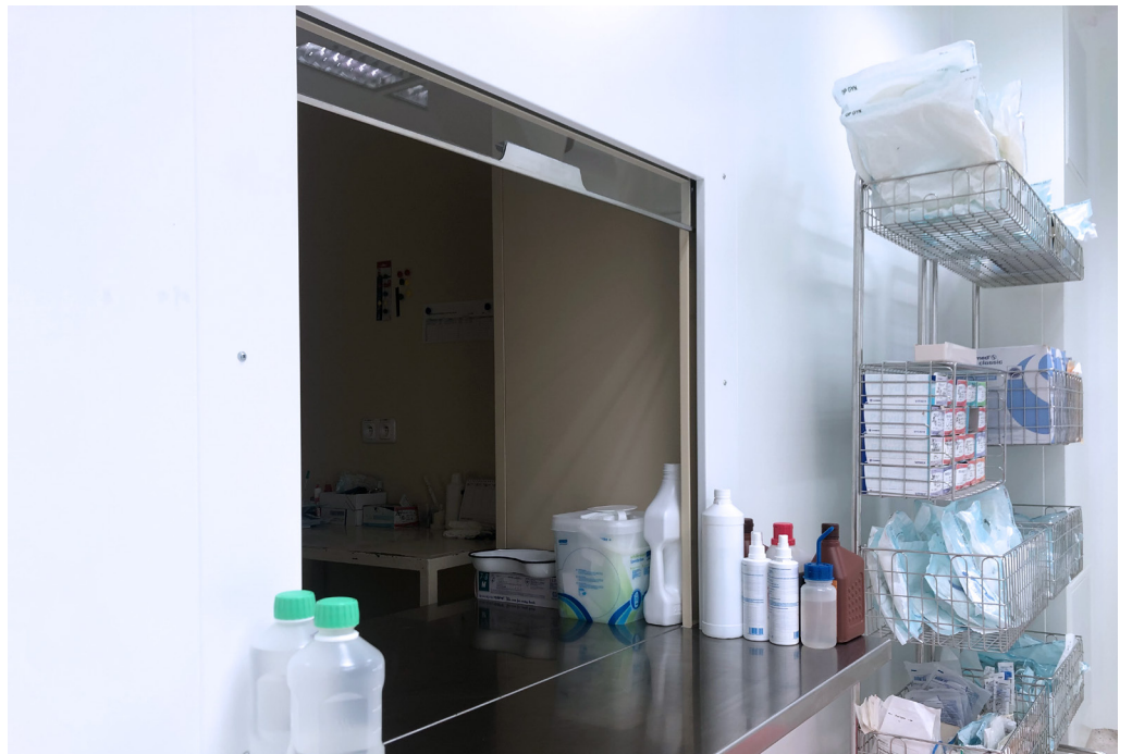
Fakultná nemocnica s poliklinikou Skalica, a.s. | Faculty Hospital with Polyclinic in Skalica, a.s. | АО «Университетская больница с поликлиникой г. Скалица»