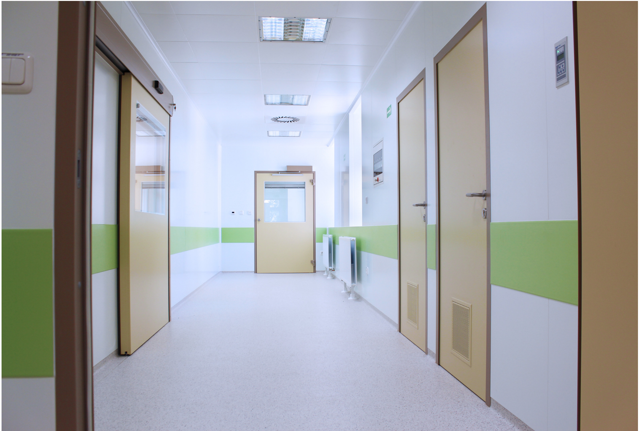
Fakultná nemocnica s poliklinikou Skalica, a.s. | Faculty Hospital with Polyclinic in Skalica, a.s. | АО «Университетская больница с поликлиникой г. Скалица»