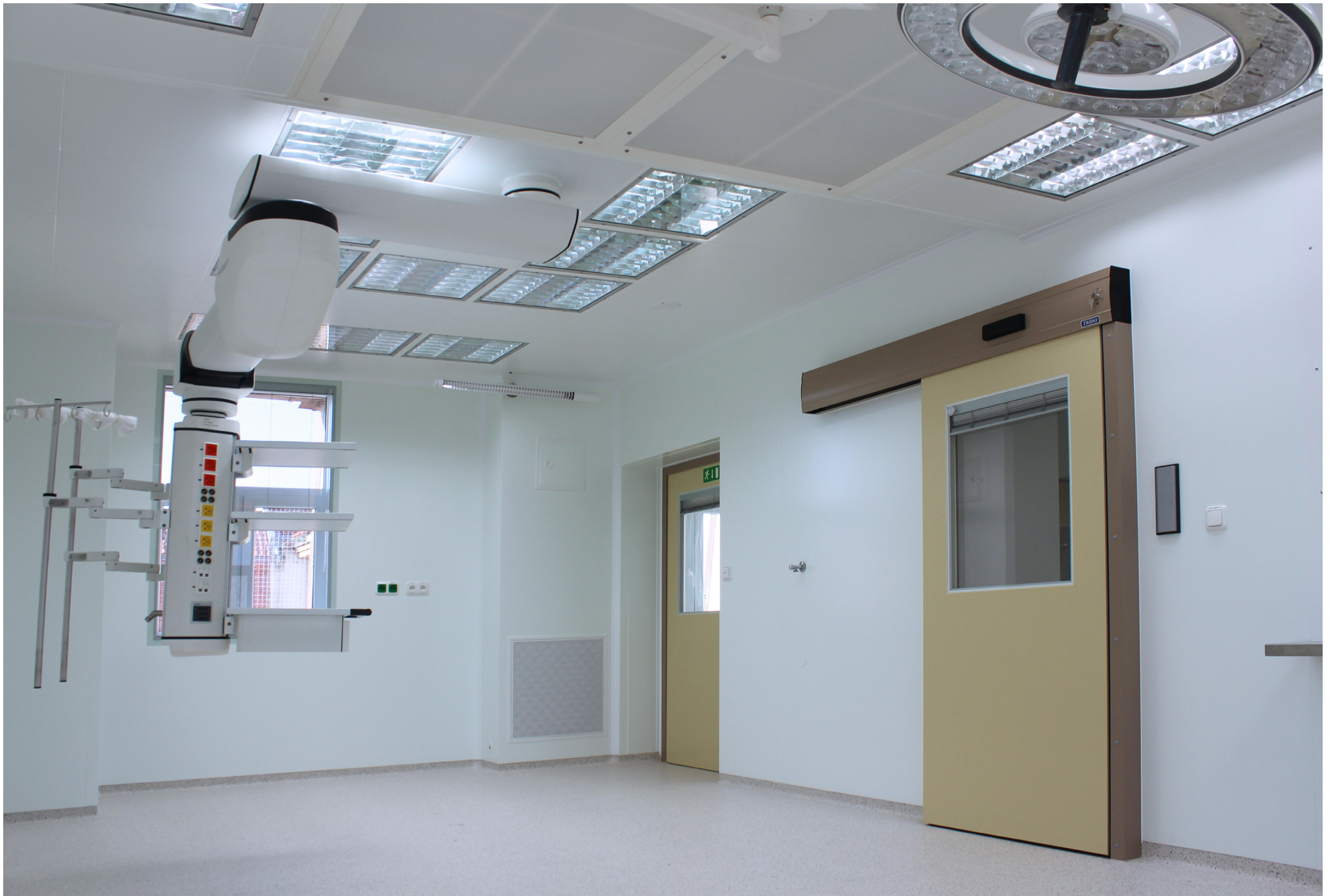
Fakultná nemocnica s poliklinikou Skalica, a.s. | Faculty Hospital with Polyclinic in Skalica, a.s. | АО «Университетская больница с поликлиникой г. Скалица»