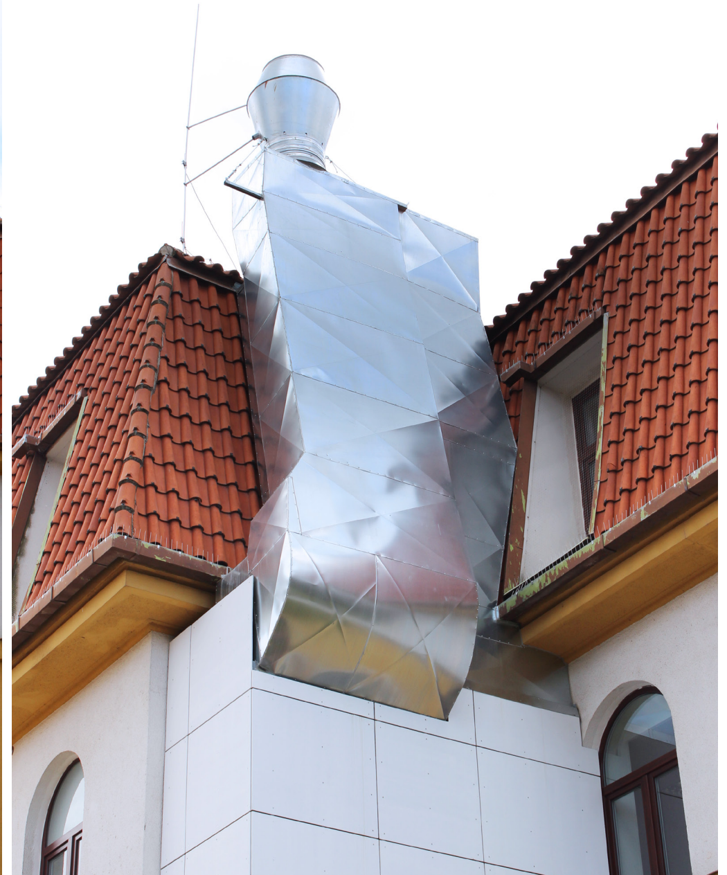
Fakultná nemocnica s poliklinikou Skalica, a.s. | Faculty Hospital with Polyclinic in Skalica, a.s. | АО «Университетская больница с поликлиникой г. Скалица»