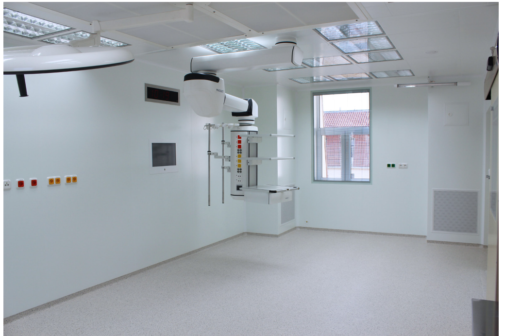
Fakultná nemocnica s poliklinikou Skalica, a.s. | Faculty Hospital with Polyclinic in Skalica, a.s. | АО «Университетская больница с поликлиникой г. Скалица»