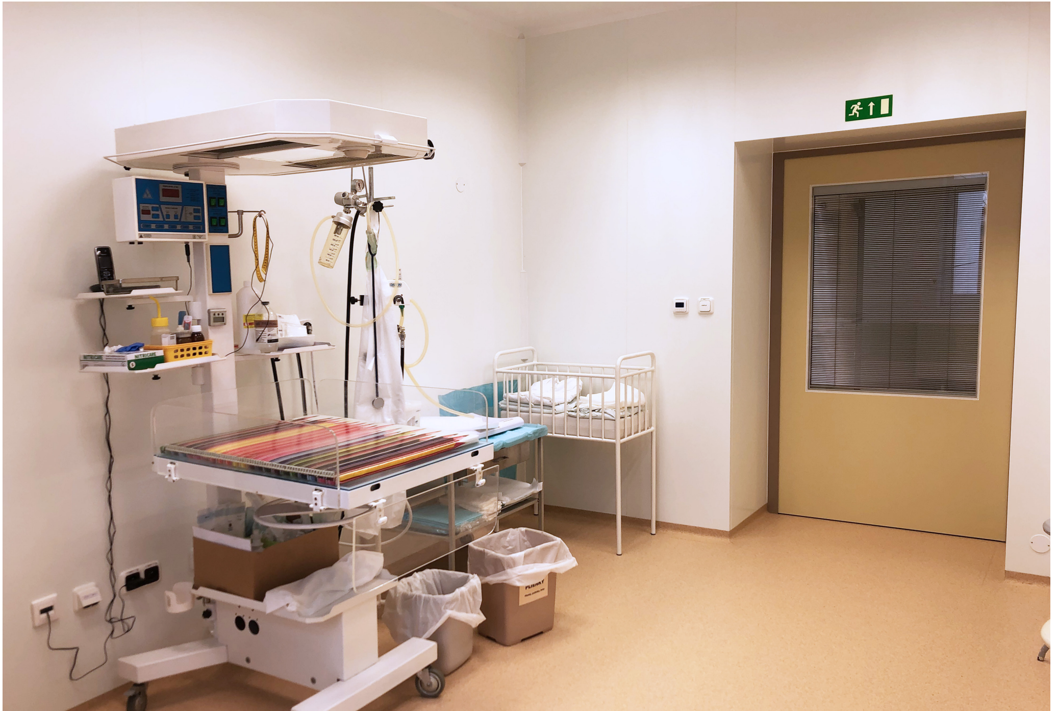
Fakultná nemocnica s poliklinikou Skalica, a.s. | Faculty Hospital with Polyclinic in Skalica, a.s. | АО «Университетская больница с поликлиникой г. Скалица»