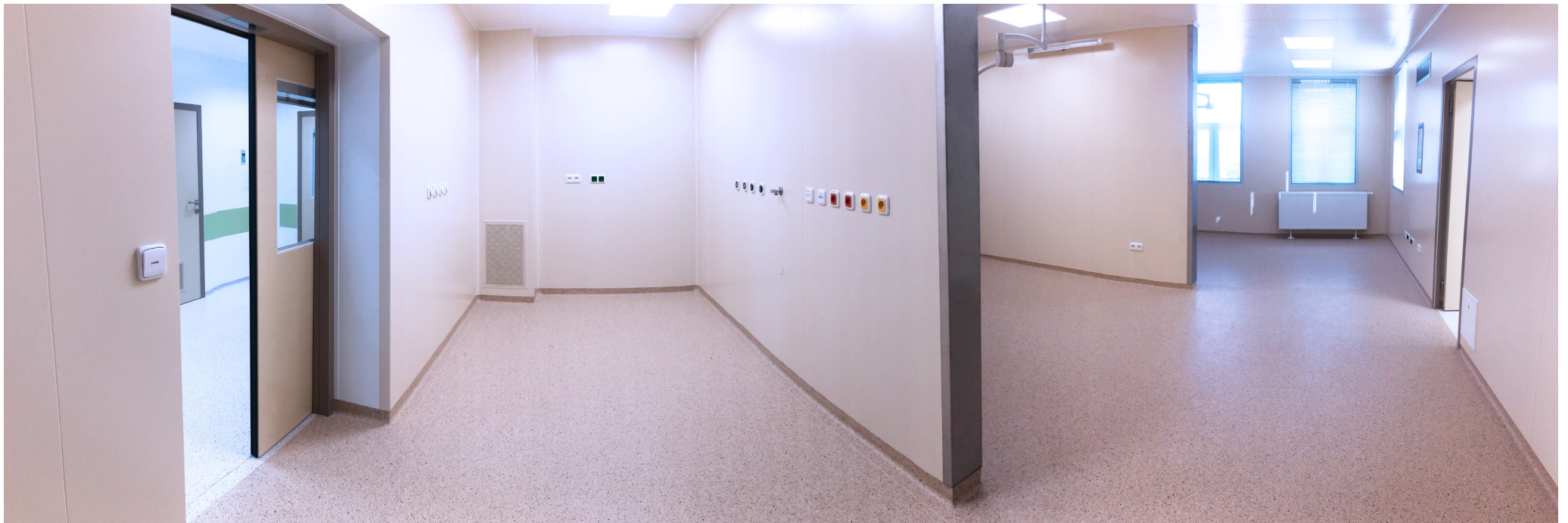
Fakultná nemocnica s poliklinikou Skalica, a.s. | Faculty Hospital with Polyclinic in Skalica, a.s. | АО «Университетская больница с поликлиникой г. Скалица»