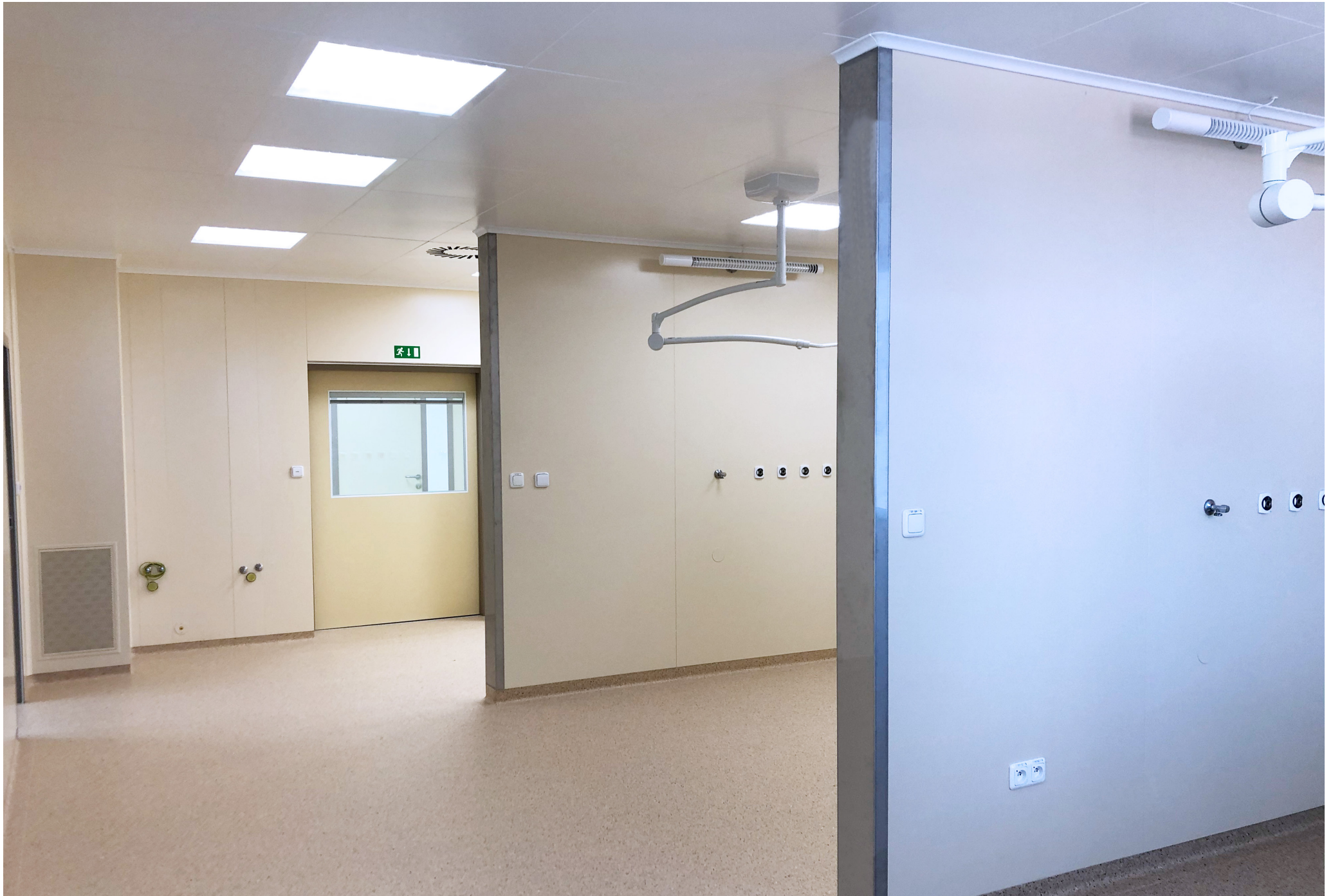
Fakultná nemocnica s poliklinikou Skalica, a.s. | Faculty Hospital with Polyclinic in Skalica, a.s. | АО «Университетская больница с поликлиникой г. Скалица»