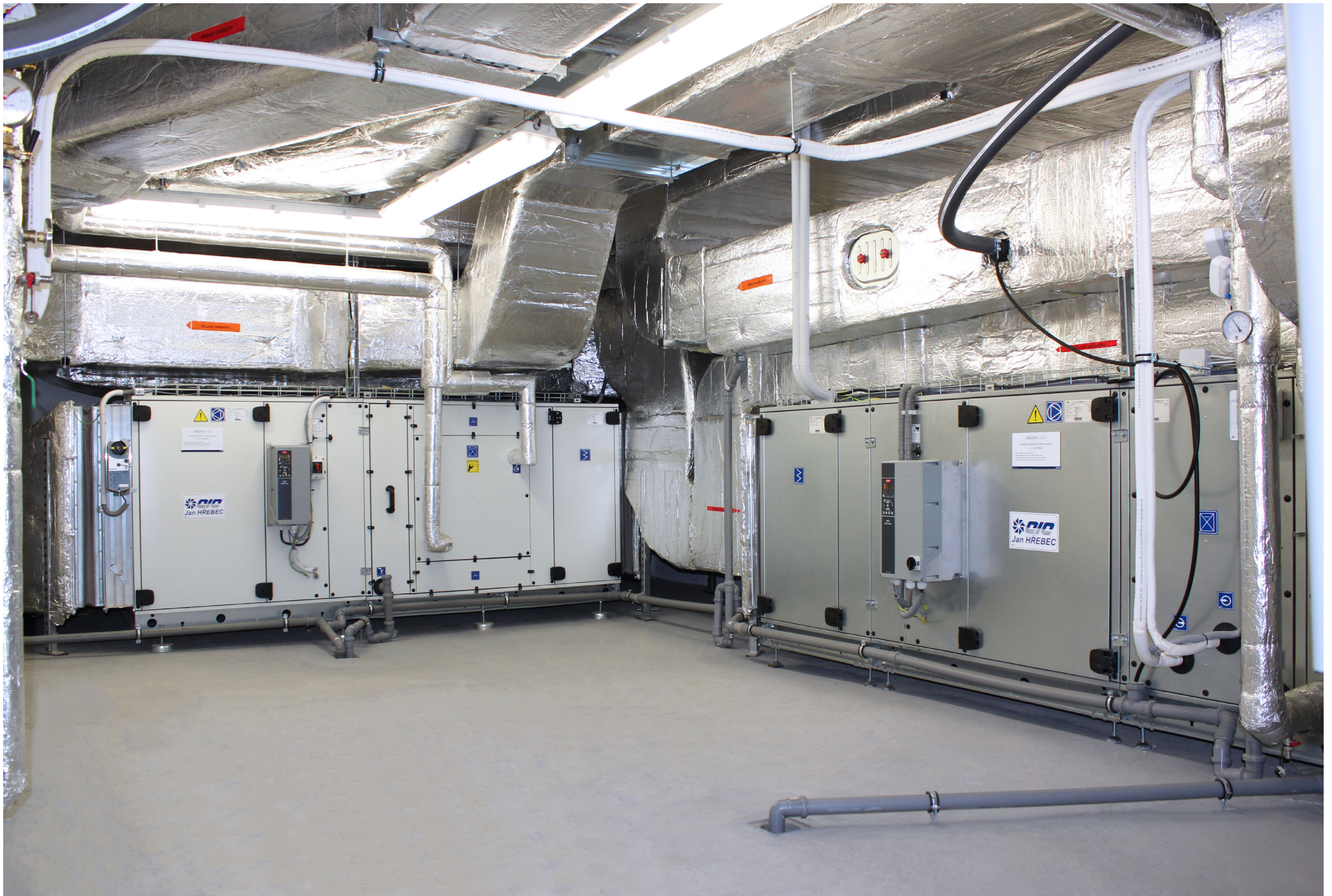
Fakultná nemocnica s poliklinikou Skalica, a.s. | Faculty Hospital with Polyclinic in Skalica, a.s. | АО «Университетская больница с поликлиникой г. Скалица»