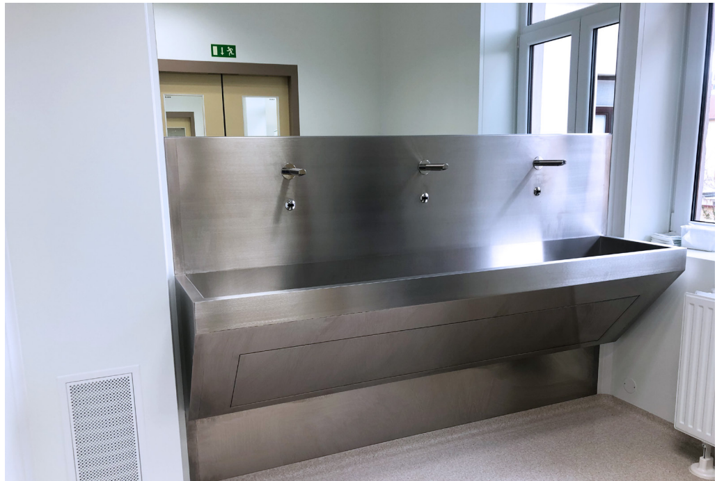
Fakultná nemocnica s poliklinikou Skalica, a.s. | Faculty Hospital with Polyclinic in Skalica, a.s. | АО «Университетская больница с поликлиникой г. Скалица»