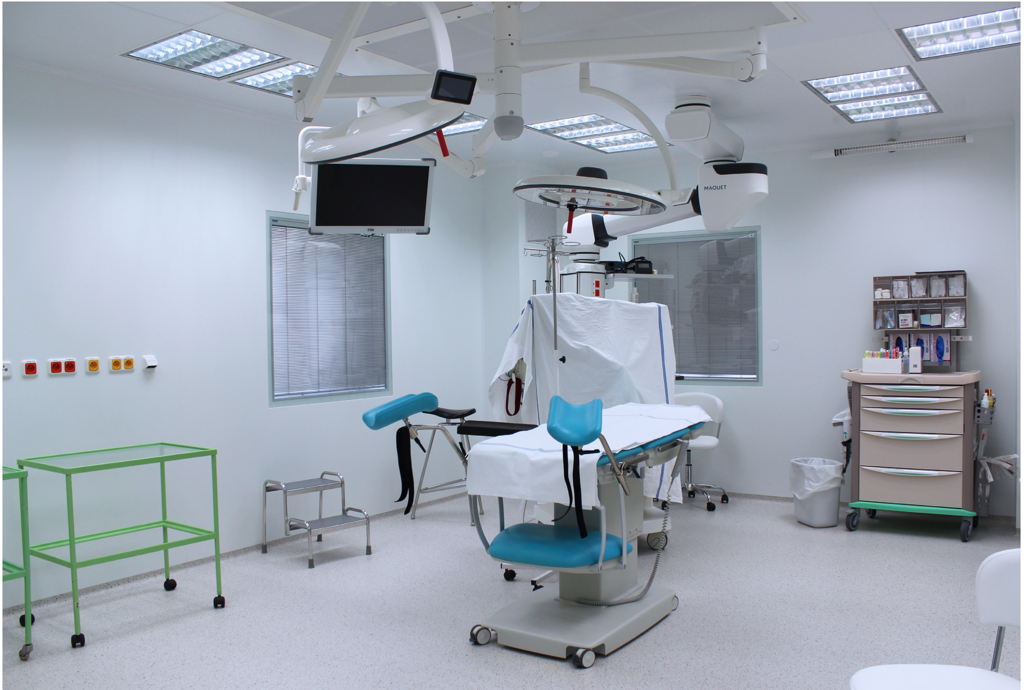
Fakultná nemocnica s poliklinikou Skalica, a.s. | Faculty Hospital with Polyclinic in Skalica, a.s. | АО «Университетская больница с поликлиникой г. Скалица»