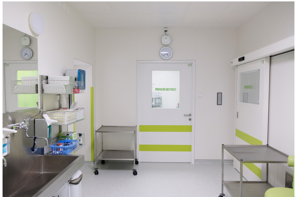
Modernization of the operating theatre environment to the AGEL Přerov Hospital | Czech Republic | 2022