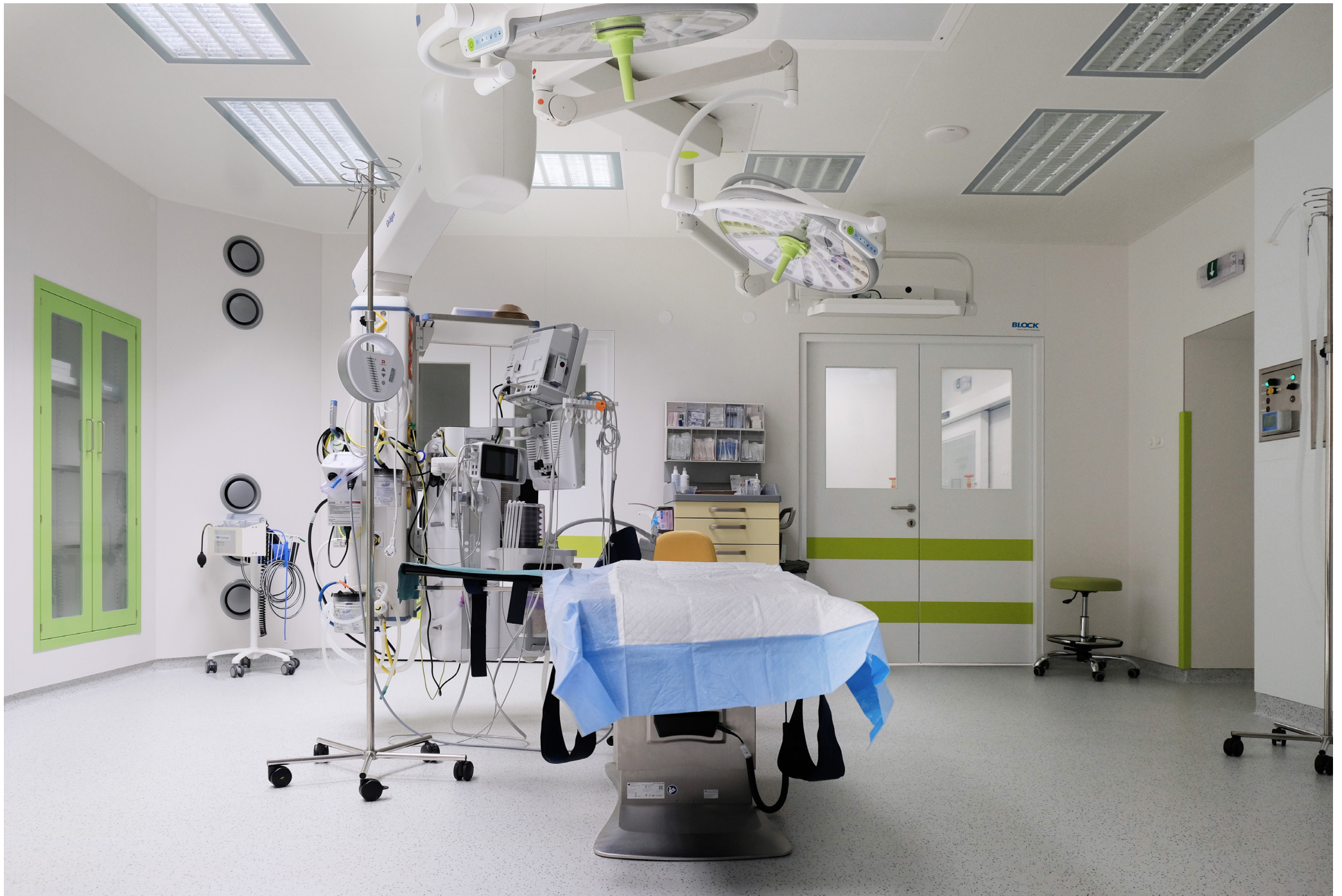
Modernization of the operating theatre environment to the AGEL Přerov Hospital | Czech Republic | 2022