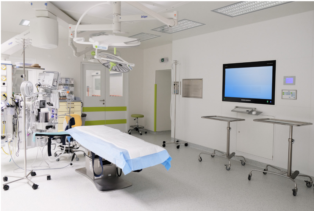
Modernization of the operating theatre environment to the AGEL Přerov Hospital | Czech Republic | 2022