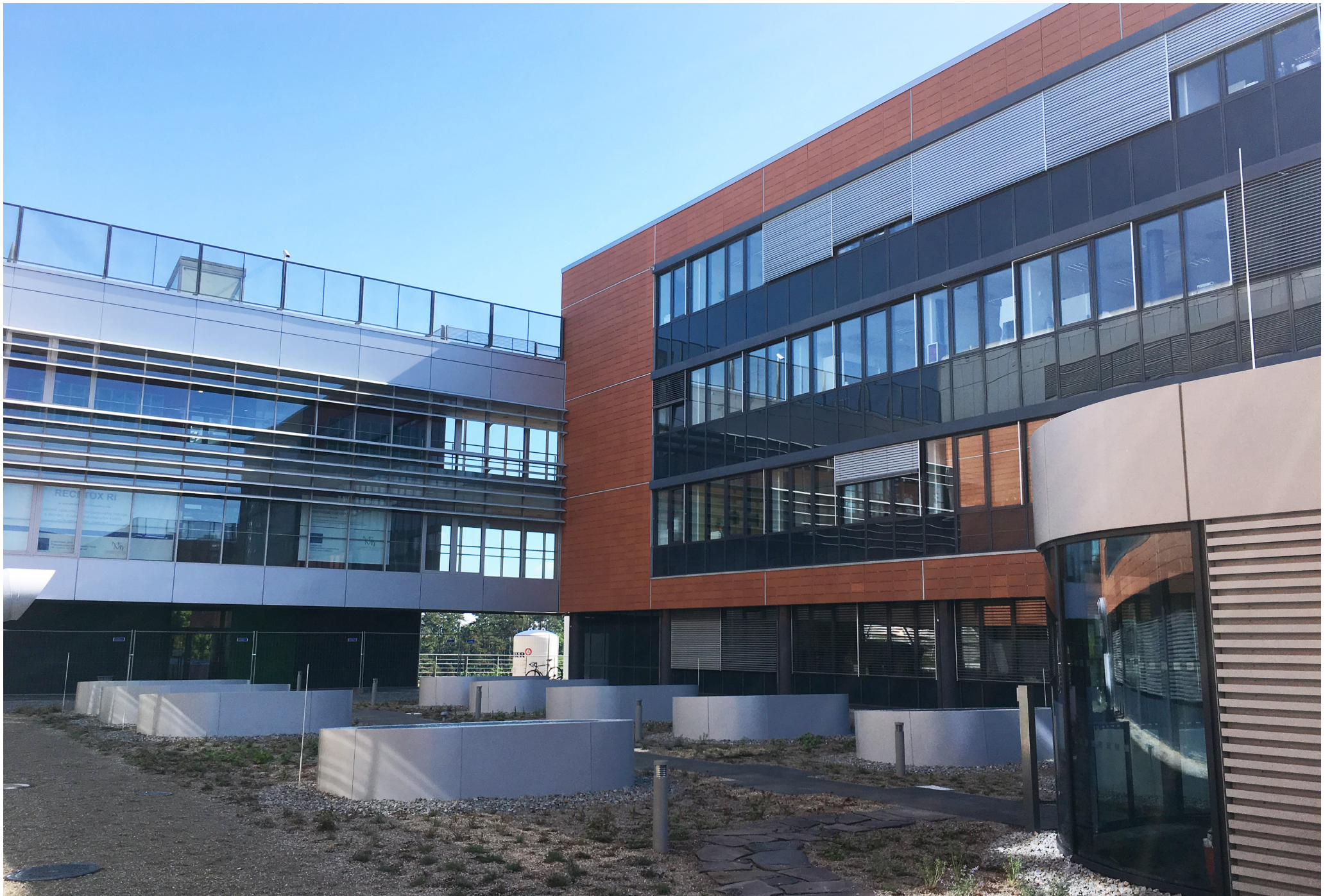
General Constructing for CETOCOEN OP VV II Building | Masaryk University Brno | Czech Republic | 2020