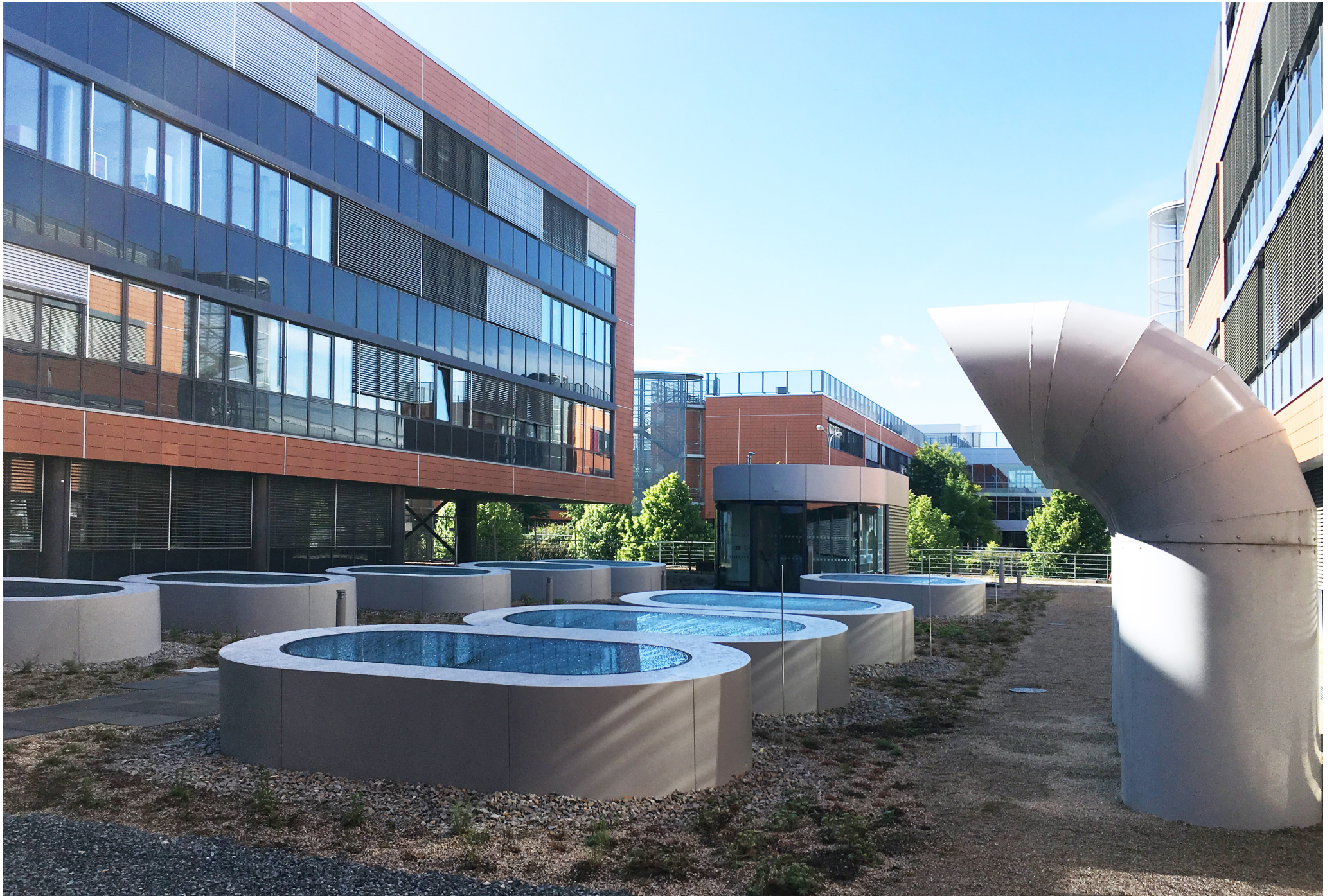
General Constructing for CETOCOEN OP VVV II Building | Masaryk University Brno | Czech Republic | 2020