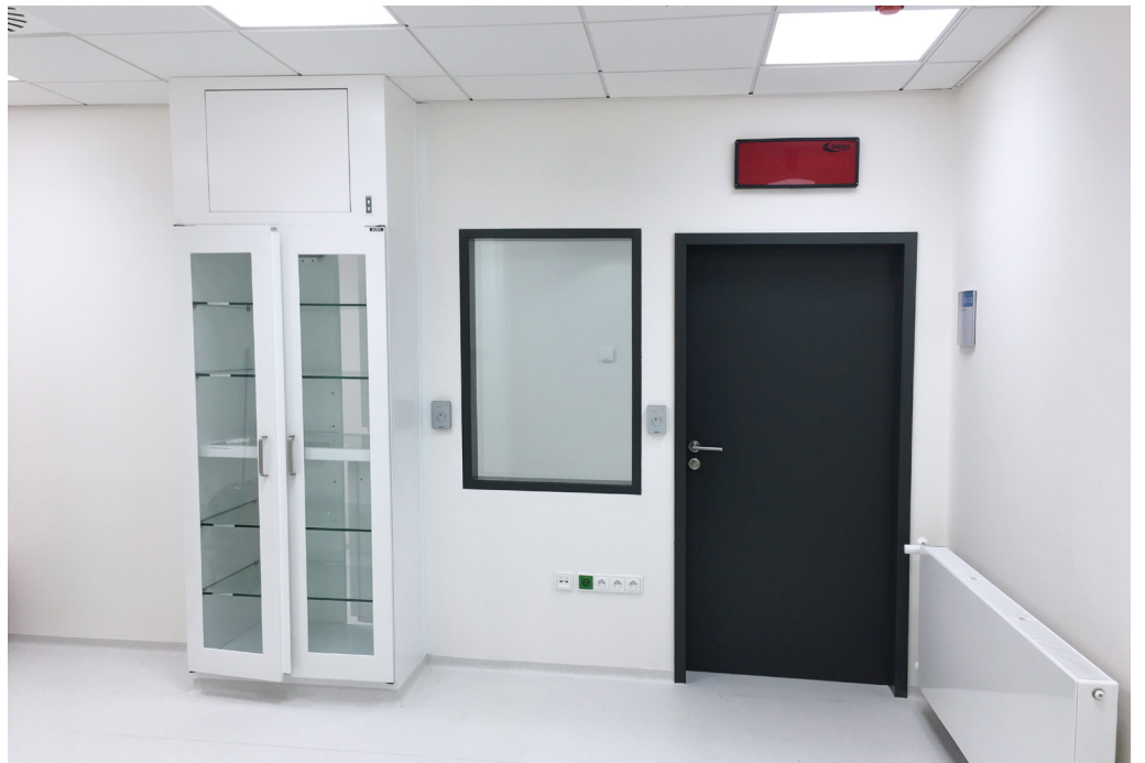
General Constructing for CETOCOEN OP VVV II Building | Masaryk University Brno | Czech Republic | 2020