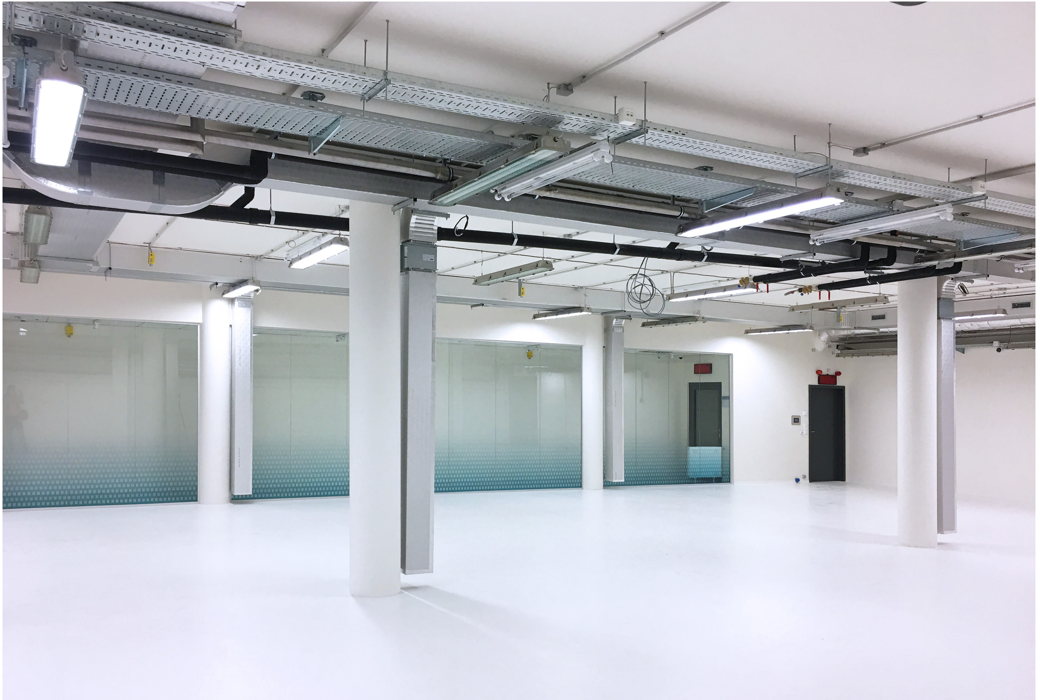
General Constructing for CETOCOEN OP VVV II Building | Masaryk University Brno | Czech Republic | 2020