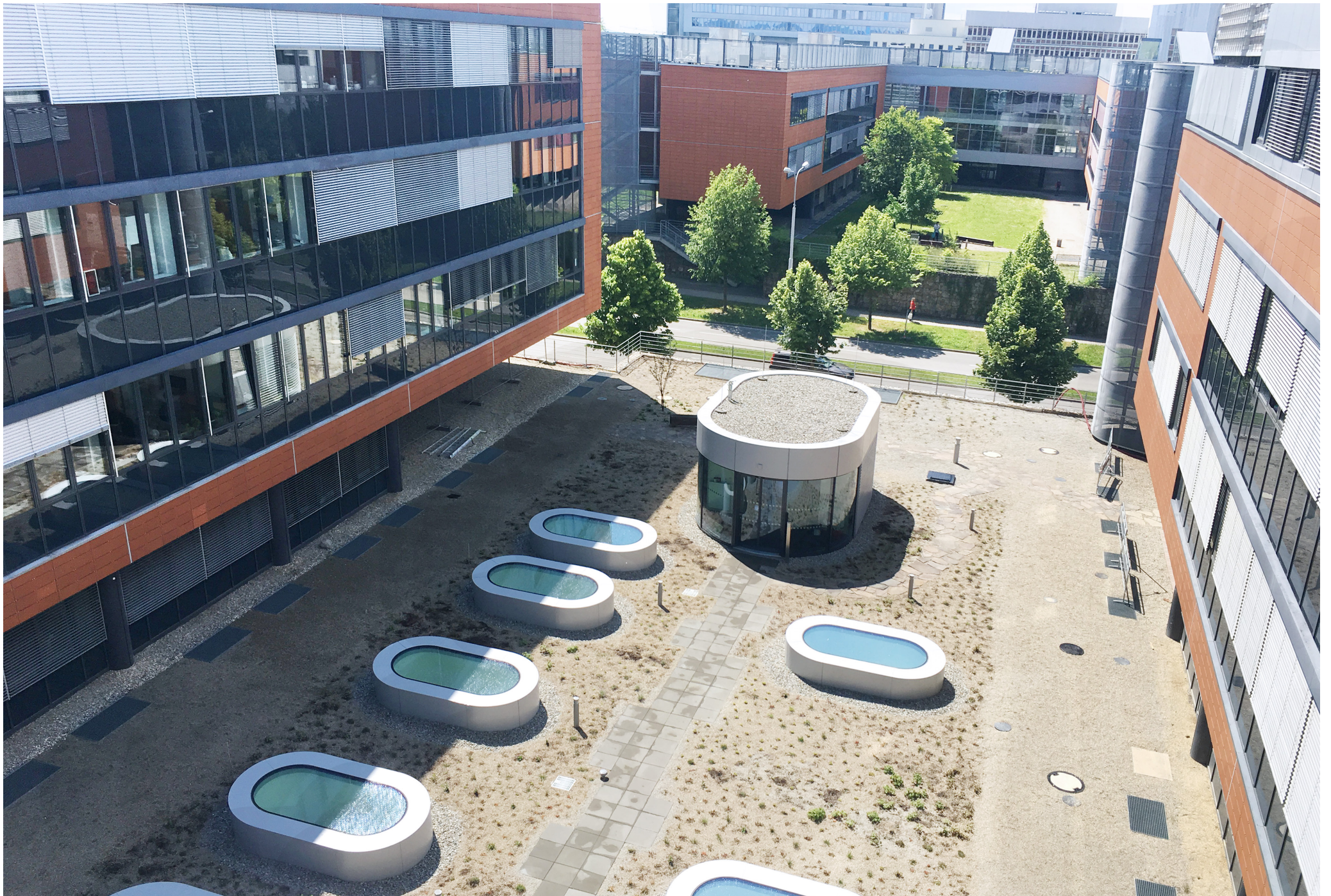
General Constructing for CETOCOEN OP VV II Building | Masaryk University Brno | Czech Republic | 2020